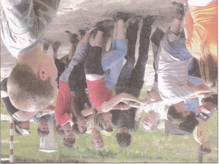
A madarak és fák napján játékos feladatokat oldottak meg az iskolások