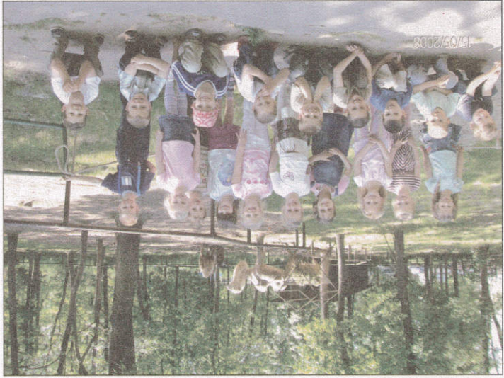
A középsők a szegeci vadasparkban jártak