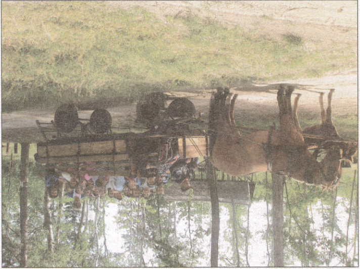
A nagycsoportosokat a Balla család vitte kirándulni a parkerdőbe