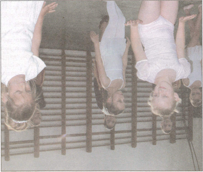
A legkisebb balettnövendékek