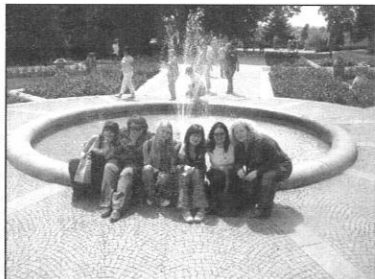
A fúvószenekar lányai Deggenhausertal

1991-ben, illetve 1992-ben került sor a hivatalos okiratok aláírására császártöltésen és Dggenhausertalban. 15 év elteltével partnerközségünk