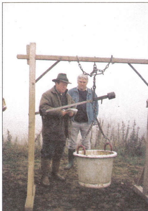
Mérlegelik a „nagy fogást”