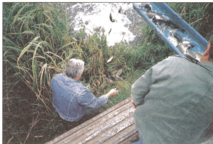
Telepítés a császártöltési horgásztavaknál

akácfaikat, ha pedig virágzik az akác, akkor eszik a harcsa- tartja a régi halász- horgász hiedelem. Bizva az évszázados bölcsesség igazában május 11-12-én az akác-