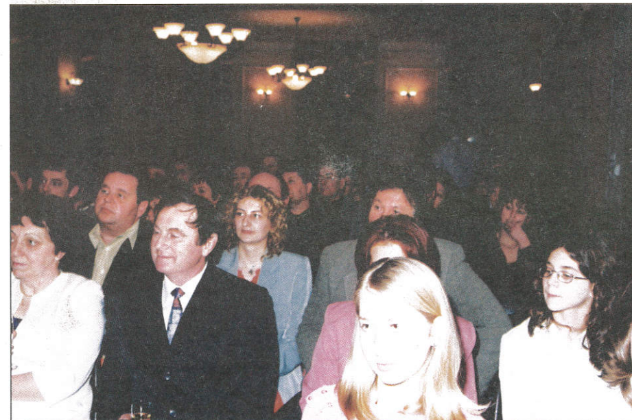
A községi rendezvényeket támogatók egy csoportja az ünnepségen