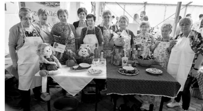
A SchwabÍz Klub tagjai képviselték Császártöltést Geresdlakon, ahol egy nagyon jó hangulatú fesztiválon vettek részt.