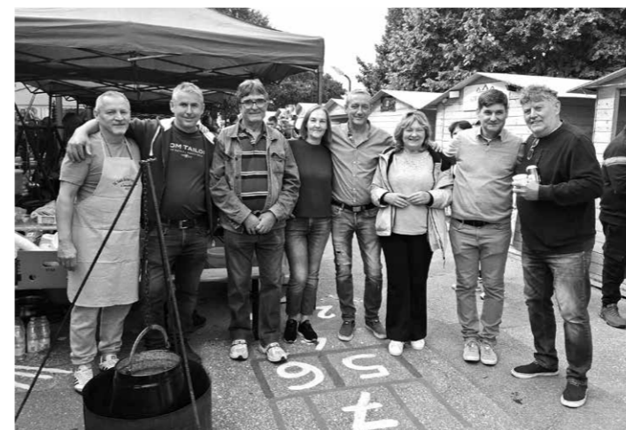
Meghívást kaptunk Kecelre, a Birkafőző fesztiválra. A rögtönzött csapat méltón képviselte Császártöltést.