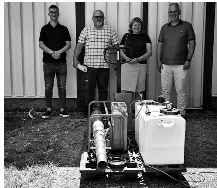
Szúnyoggyérítésre alkalmas hideg- és melegködképző gép áll szolgálatba a Sváb-sarokban.

Császártöltés, Érsekhalma, Hajós és Nemesnádudvar települések a közeljövőben ezzel a hatékony eszközzel, környezetkímélő módon védekezhetnek a szúnyogpopuláció ellen.