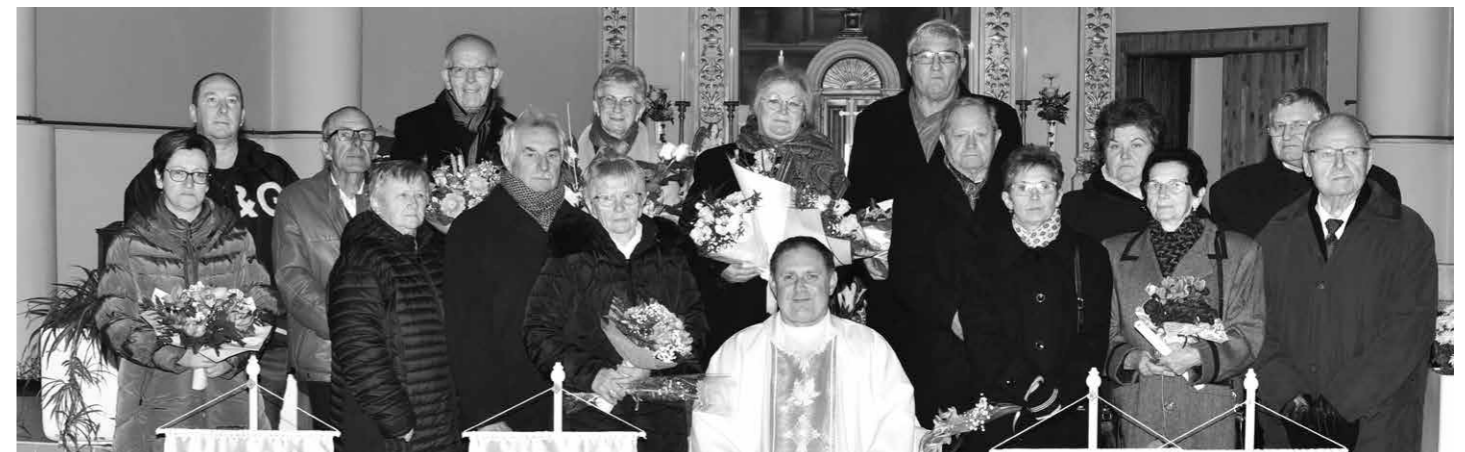
Szeretettel köszöntjük a jubiláló házaspárokat!