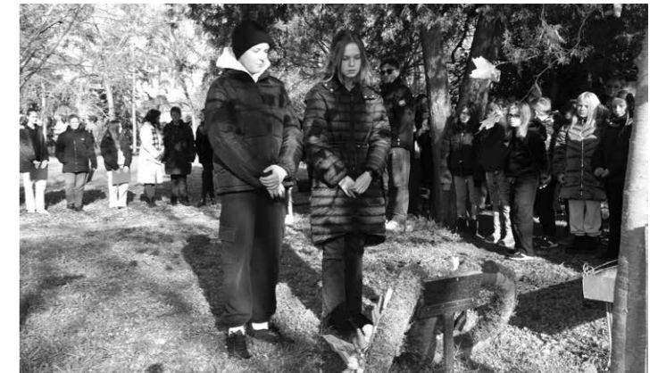
Emlékműsorral és koszorúzással emlékeztünk novemberben a Málénkij robot áldozataira.