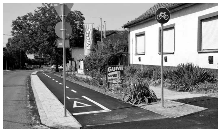
Elkészül a belterületi kerékpárút II. szakasza a Keceli utcán