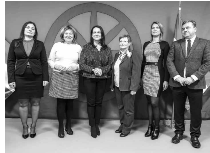
Az 5. számú választókerület polgármesterei találkoztak Novák Katalin köztársasági elnökkel