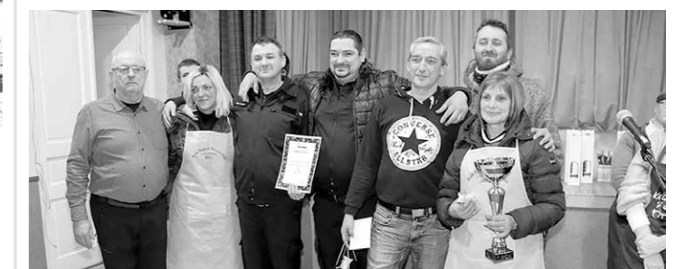
I. HELYEZETT Töltési Töltikék