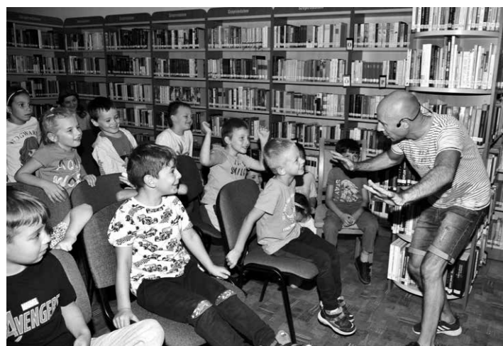
Ribzli bohóc a könyvtárban tartott jóhangulatú foglalkozást a Bánátisoknak.