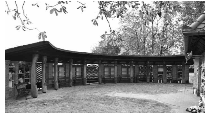
A Magyar Falu program pályázatából tudtuk bővíteni az Öregtemetőben az urnafalat