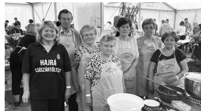
Geresdlakon, a Gőzgombóc Fesztiválon Császártöltést képviseltük

Versenyt futunk az idővel, kapkodunk, rohanunk, semmire sem érünk rá. Aztán a nagy rohanást felváltja a döbbséges csend, amikor ráébredünk, valamit elfelejtettünk és már nem tudjuk pótolni sohasem. Csak az ígéret marad, ami tompán kong a fejünkben: Igen, majd megyek, majd beszélgetünk egy jót... aztán már nem történhet meg, nem beszélgethetünk, mert már