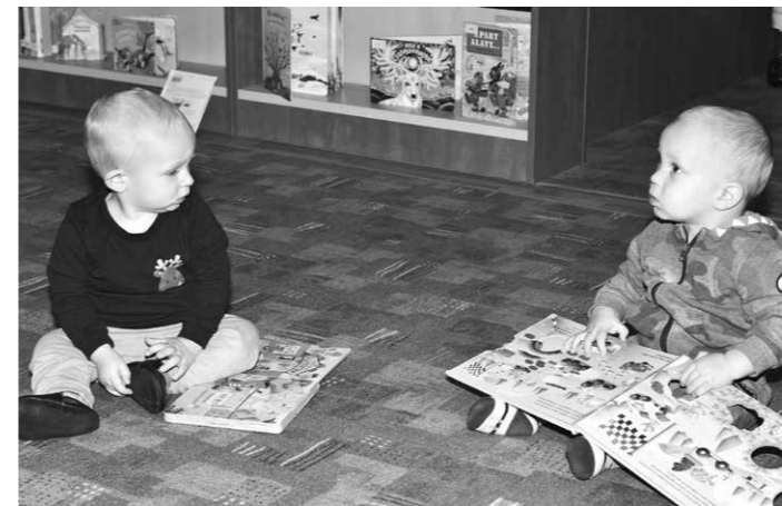
Baba-Mama Klub a könyvtárban