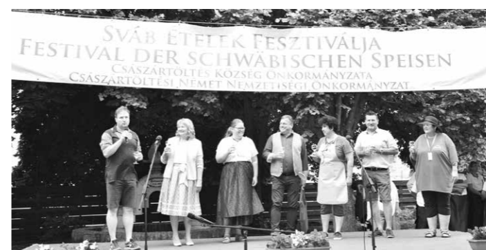
Koccintás a III. Sváb Ételek Fesztiválján