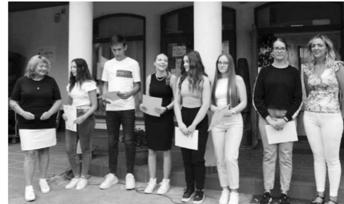
Középiskolás, főiskolás és egyetemista jó tanulók díjazása a Falualapítók Ünnepe