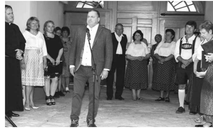
Sváb Értéktár kiállítás megnyitása. Bányai Gábor országgyűlési képviselő köszönti a megjelenteket