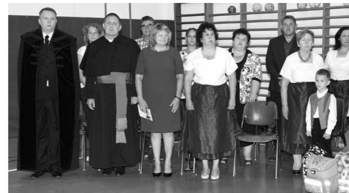
Tanévnyitó a Bánátiban