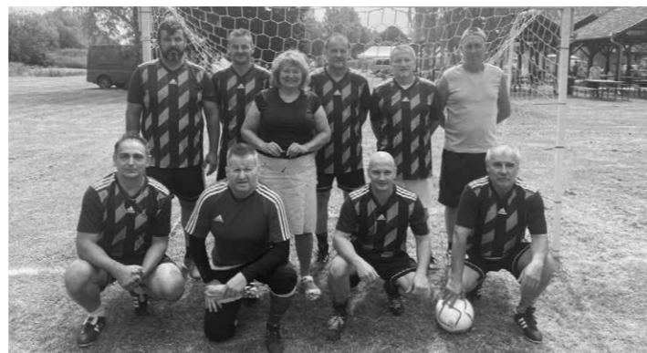
A II. Sváb Sarok Találkozón a négy település közötti barátságos futball mérkőzést Császártöltés csapata nyerte meg, és hozta el a Vándorkupát. Gratulálunk a csapatnak!