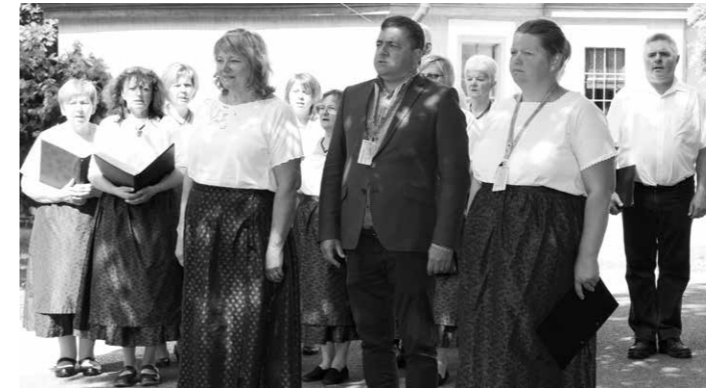
Bányai Gábor országgyűlési képviselő is részt vett a II. Sváb Ételek Fesztiválján 2022. június 11-én

2022. augusztus 12-én, pénteken 17.00 órakor átadjuk azt a kiállítást, ahol bemutatjuk értékeinket, mindazt, amit elődeink évszázadok alatt létre hoztak, megőriztek Császártöltésen, és mindazt a kulturális, eszmei és épített örökséget, amivel a jelenkorban mi magunk járultunk hozzá a falu gyarapodásához. A ház szépen felújítva, a kiállítás gondosan berendezve és mikor végig tekintünk mindezen, gondolatainkból nem tudjuk elúzni a körülöttünk zajló háborút és kihatásait. Vajon megmarad életünk úgy, ahogy eddig éltük? Megmaradnak emlékeink? Vagy minden átalakul, megváltozik és maradnak a nehézségek? A kiállítás megnyitásán közös imával kérjük a Mindenhatót, segítse a béke mi-