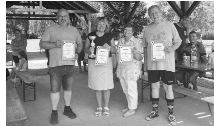
A II. Sváb Sarok találkozón, Nemesnáduvvaron, a négy település polgármestere is részt vett