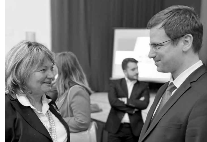
Találkozás Gulyás Gergely miniszterelnökséget vezető miniszterrel