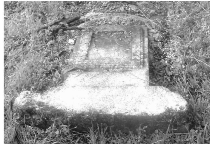
Császártöltés Község Önkormányzata együttműködve a MAZSIHIZS-szel, áprilisban elkezdte a zsidó temető helyreállítását