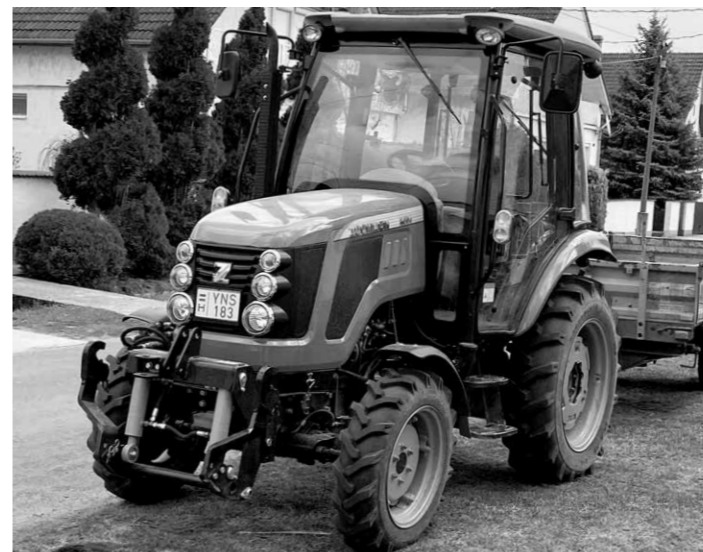
Császártöltés Község Önkormányzata a Magyar Falu pályázatán egy Zoomlion típusú zetort nyert. A zetort nélkülözhetetlen a mindennapi munkánkban. Köszönjük!