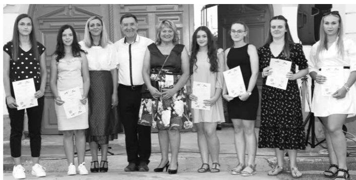
A Császártöltés Fejlesztéséért Közalapítvány idén is díjazta a jó tanulókat. Gratulálunk nekik!