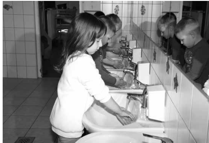
Az óvodai mosdókba új mosdókapylók és csaptelepek kerültek felhelyezésre