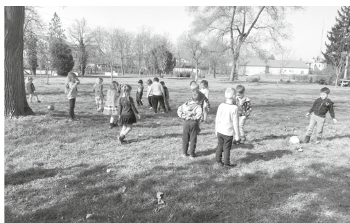
Amikor az idő engedi az óvodai tornafoglalkozásokat a Ligetben tartják meg.