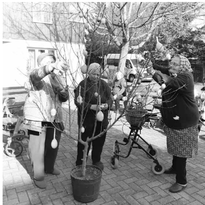
Húsvéti készülődés a Császártöltési Idősek Otthonában