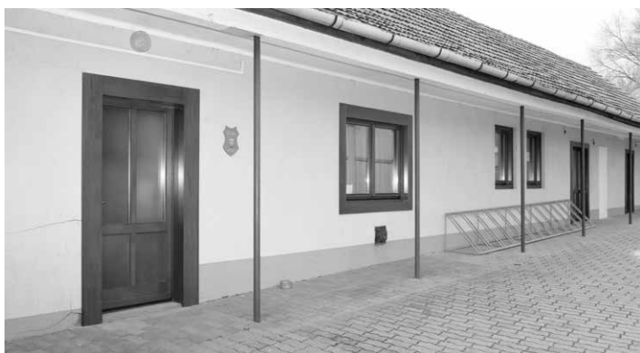
Ajtókat, ablakokat cseréltünk az Angeli Mátyás Közösségek Háza hátsó traktusán. A Fazekas Ház, az edzőterem és a hátsó raktárak kaptak új nyílászárókat