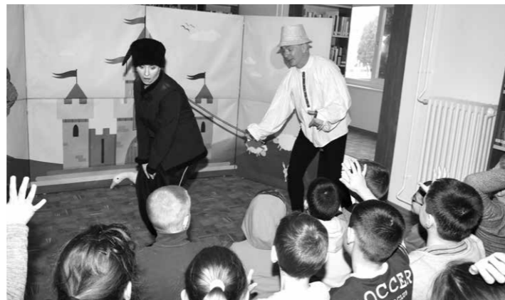
A Léghajó Mesesínház a Könyvtárban az alsós diákoknak a Ludas Matyi zenés interaktív előadását tartotta nagy sikerrel

zatú fésűvel el kell távolítani. A szerrel a család többi tagját is le kell kezelni! Fertőzött gyermek ágyneműjét, ruházatát 60 fokon át kell mosni, a használati tárgyakat fertőtleníteni kell!