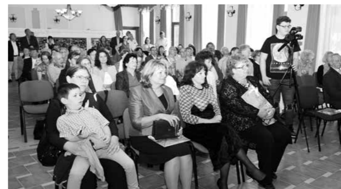
Az Angeli családok találkozója Császártöltésen