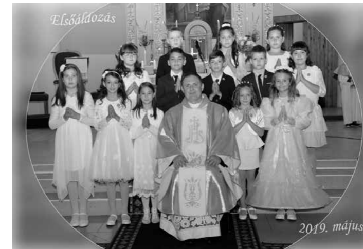
Elsőáldozás Császártöltésen 2019

ez? Talán azért is, mert a témánk közt túl sok negatív dolog szerepel, panasz, sértődékenység, bosszúvágy, megszólások. Elsekélyesedtek a találkozások. Nem érezzük a másokban az érdeklődést sikereink iránt, nem