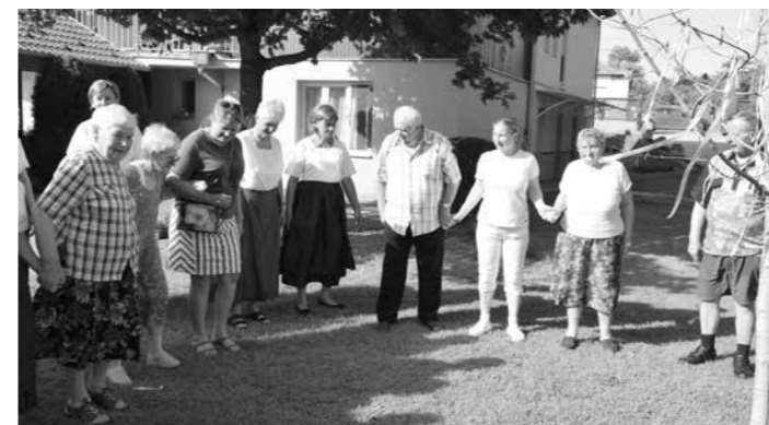
Májusfa kitáncolás az Idősek Otthonában

Volt egy álmunk, hogy élhető és ez által megtartó falut építsünk. Felújítjuk mindazon középületeket, az töltésieknek sokat jelentenek, az életüket szolgálják: az óvodát, a könyvtárat, az iskolai konyhát, az orvosi rendelőt, közösségek házáat, tájházát. Önkormányzati kertészetet hoztunk létre, hűtőházunk lett és üvegházaink, fóliasátrunk és fűrt kútjaink. Parkolókat építettünk és felújítottuk a fűtet. Volt egy álmunk, hogy élhető falut építsünk és megvalósítottuk.