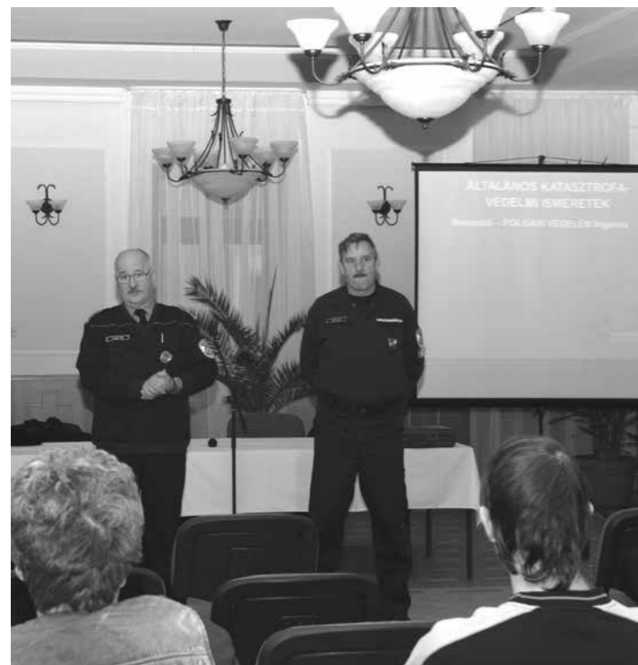
Katasztrófavédelmi képzés Császártöltésen 2018. november 22-én

hogy a talajterhelési díjat a kibocsátónak önadózás formájában kell bevallania és egy összegben megfizetnie tárgyévét követő év március 31. napjáig, tehát a 2018. évre vonatkozóan 2019. március 31. napjáig. A kibocsátónak a bevallást az önkormányzat adóhatóságánál kell teljesítenie az erre a célra rendszeresített formanyomtatványon, mely érintettek részére a bevallási határidőt megelőzően kézbesítésre kerül. A megállapított talajterhelési díjat Császártöltés Község Önkormányzata javára kell megfizetni.