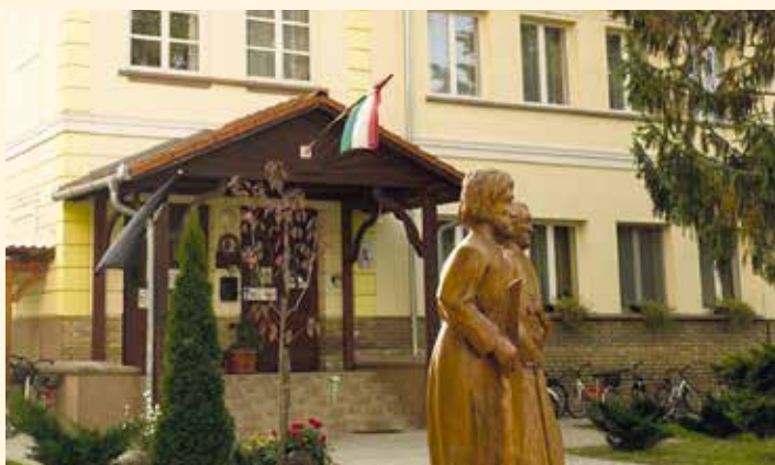
Német nemzetiségi fenntartású iskola, óvoda