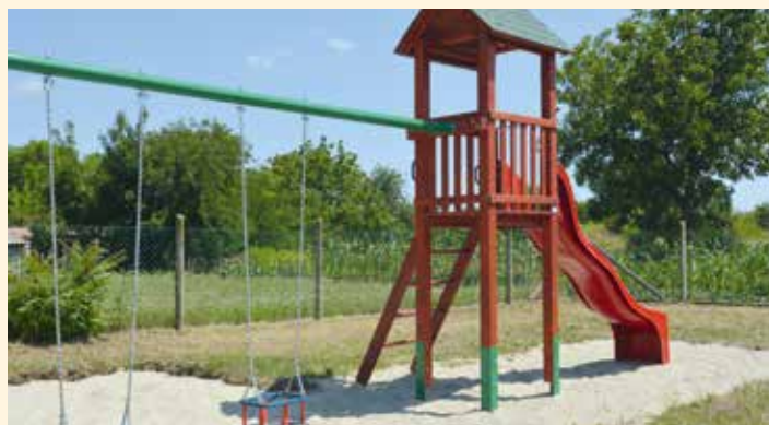
Kiscsalai játszótér felújítása