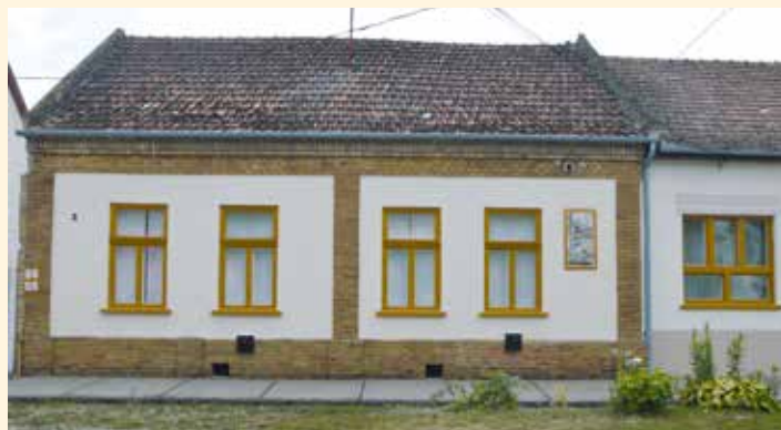
Képes ház felújítása és a kiállítás megnyitása