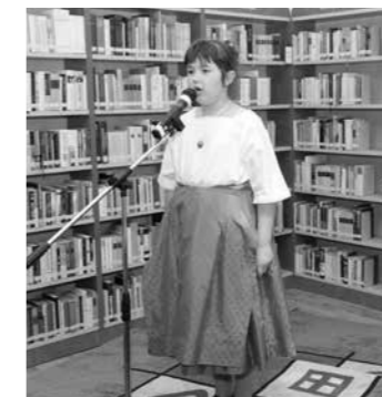
a kép egy korábbi szavalóversenyen készült