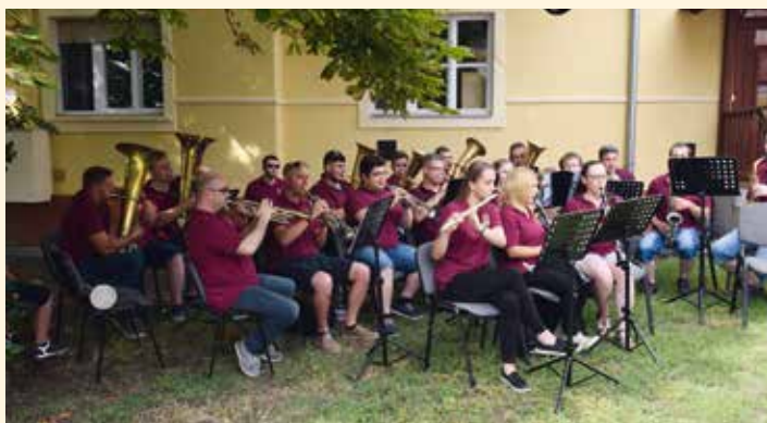
Császártöltési Fúvószenekar újraindítása