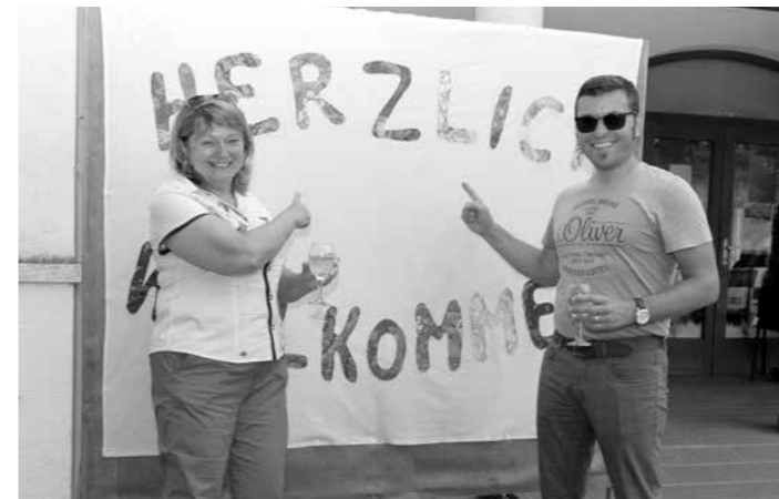
Takácsné Stalter Judit polgármester és partnertelepülésünk, Deggenhausertal polgármestere Fabian Meschemosser

A megmaradáshoz sok minden kell: élhető falu, benne munkahelyek, de ne feledjék, az Önkormányzat nem munkahelyeket, hanem hátteret terem! Ilyen háttér a jó oktatási rendszer, a jól felszerelt könyvtár, a korszerű egészségügy, de szorosan ide tartozik a jó marketing, hogy ide jöjjenek a vendégek, és itt nálunk költsék el a pénzüket.