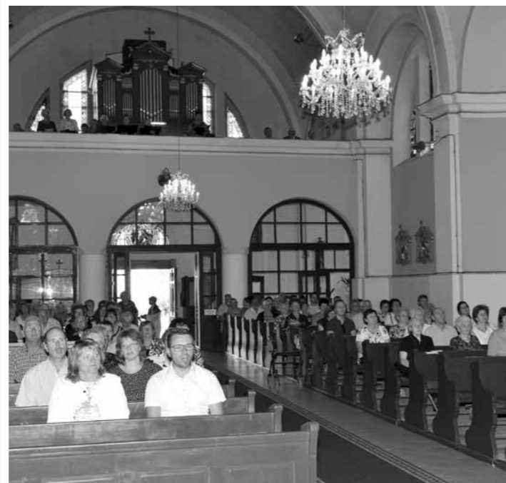
Német nyelvű mise deggenhausertali vendégeink tiszteletére

Közösségi érdek, és mindenkinek a saját érdeke az árkok tisztántartása a csapadékvíz okozta károk megelőzése, illetve enyhítése érdekében. A település rendezettségének fenntartása megköveteli az ingatlanok, illetve az ingatlan előtti közterületek tisztán tartását, azok folyamatos tisztítását, kaszálását. Felhívjuk valamennyi ingatlan-tulajdonos/használó figyelmét, hogy tegyen eleget ezen felhívásban foglaltaknak, még akkor is, ha ingatlanjukat nem használják és azok lakatlanok! Igazi eredmény eléréséhez szükség van a településen lakók együttműködésére. Ezúton szeretnénk megköszönni mindazon császártöltési lakos munkáját, aki a felhívásban foglaltaknak eleget tesz, és a jövőben is a jó gazda gondosságával teljesíti e felhívásban megfogalmazott kötelezettségeket.