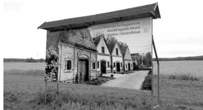
Üdvözlő óriásplakát a falu szélén

Mindhárom pályázat kiírását a korábbi intézményvezetők kinevezési, megbízási idejének lejártá indokolta.