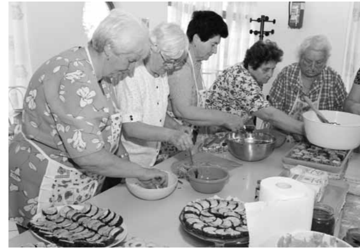
Süteménysütés a Májusfa állításra