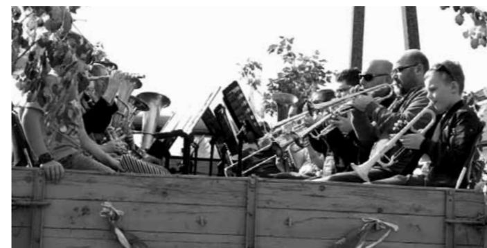
Zenés ébresztő Május elsején