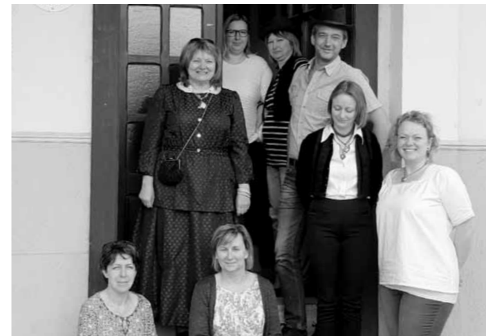
Trachttag a Polgármesteri Hivatalban