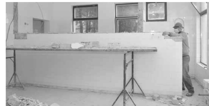
Megkezdődtek az orvosi rendelő felújítási munkálatai