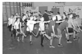
Szeptember 22-én a nyolcadikosok által összeállított tréfás feladatok megoldása után az ötödikes diákjainkat ünnepélyesen felsőssé avattuk.