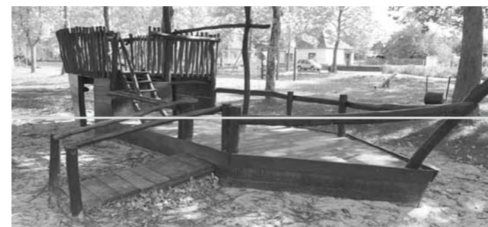
Hónapokkal ezelőtt ismeretlenek megrongálták a játszótéri hajót. A játszótér sok kisgyermeknek szerez örömet, így fontos volt hogy mielőbb javításra kerüljön a hajó. A nyár folyamán a hajó felújításra került, melyet a képviselők finanszíroztak. Köszönjük a hozzáállásukat és a segítséget!