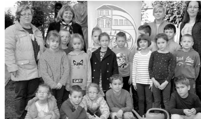
Az első osztályosok hagyományos faültetése az iskola előtt