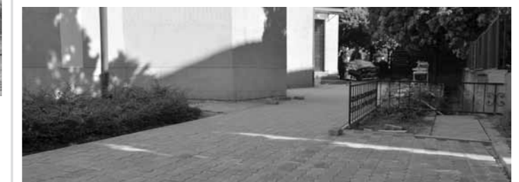
Elkészült a járda a templom déli oldalán