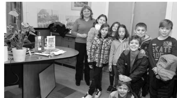
A pályaválasztási napon a gyerekek a polgármester munkájával is megismerkedtek