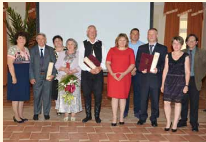
Csoportkép a 2017. év kitüntetettjeivel