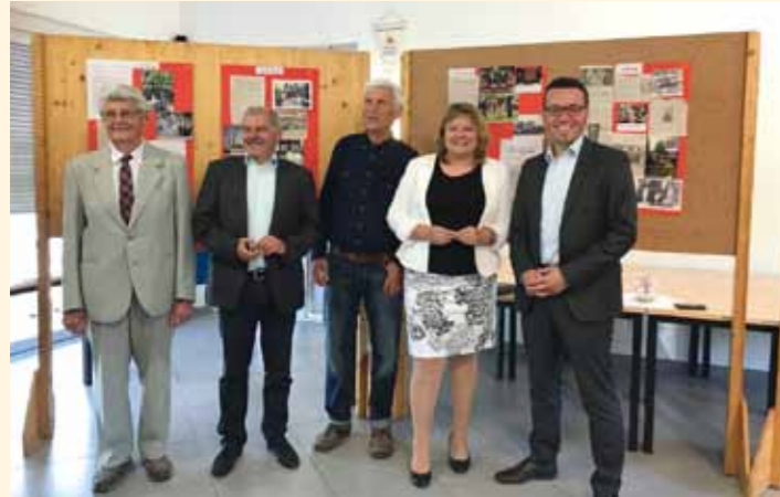
Deggenhausertal és Császártöltés 25 éves partnerkapcsolatának ünneplése Deggenhausertalban