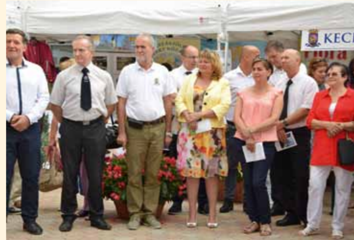
A mi járásunk - Császártöltés bemutatása Kecskeméten