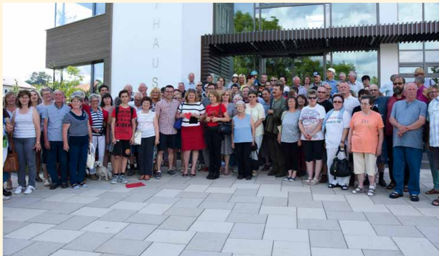
Deggenhausertal és Császártöltés 25 éves partnerkapcsolatának ünneplése Deggenhausertalban