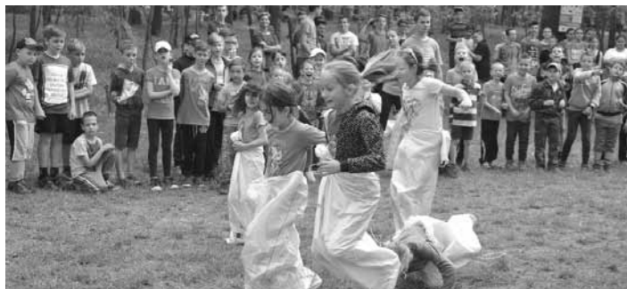
Idén is nagy sikere volt a Parkerdőben megrendezett Madarak és Fák Napja vetélkedőknek

Kiskőröstre az Önkormányzat buszával. • Július 23-tól július 28-ig iskolánk 44 tanulója és 5 kísérő 6 napos Erzsébet tábort vesz részt Zánkán, „Nekünk a Balaton a Riviéra! címmel. • A tanévnyitó ünnepséget 2017. augusztus 31-én 17.00 órakor tartjuk. • Az első tanítási napon 2017.szeptember 1-jén (péntek) kapják majd meg a tankönyveket a tanulók.