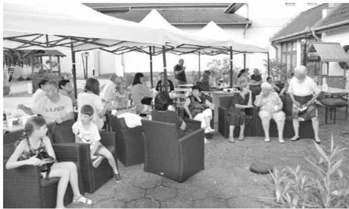
Kellemes nyáresti programot nyújtott a Tájházban és a Rózsakerthben megrendezett Múzeumok éjszakája.

sor láthatók, hallhatók az érdeklődők. A Császártöltési Táncsoport előadásával kezdődött a műsor, majd a keceli Kéknefelecs asszonykórus következett. Utánunk a szintén keceli Bogárzó Citerazenekar szórakoztatta a meglepeteket. A családi gyökerekkel rendelkező Prepszent testvérek műsora is nagy sikert aratott. A vacsora után igazi tanyasi, kemencében sült pogácsát és kelt kalácsot fogyaszthattak a vendégek, majd ezt követően hajnalig rophatták a táncot az utcabálon.