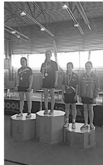
Lei Eszter III. hely