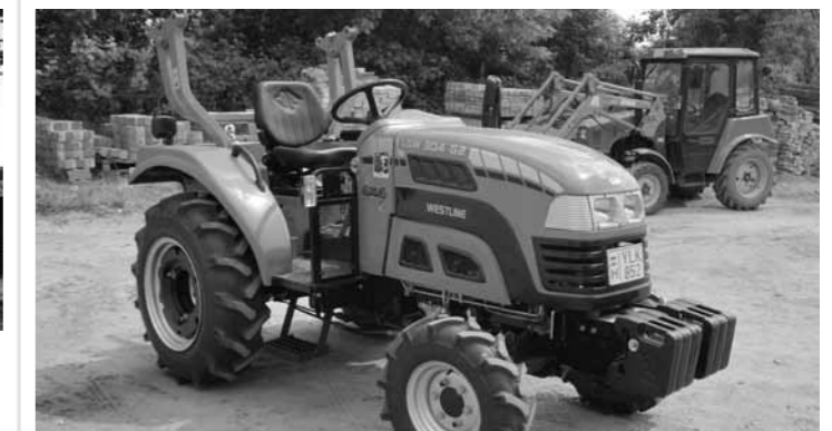
Újabb kisgéppel bővült az Önkormányzat járműparkja