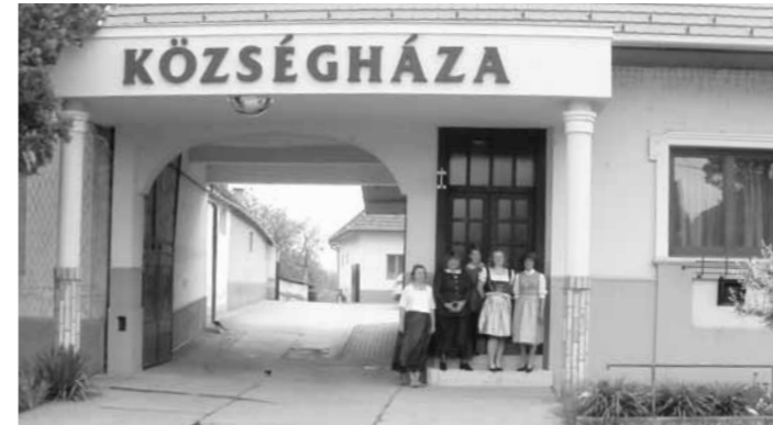
Tracht Tag a Polgármesteri Hivatalban