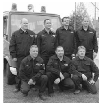
Tűzoltóverseny Solvadkertén, melyen a császártöltési Önkéntes Tűzoltó Egyesület tagjai is részt vettek.