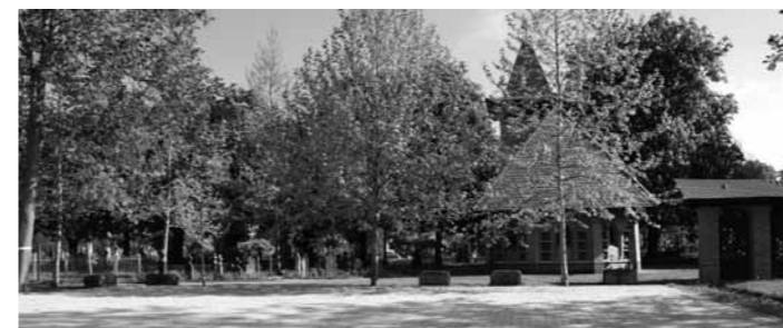
Elkészült az Öreg temető parkolója! A temető parkolóját közfoglalkoztatási program keretében készítették el, a későbbiekben térelemekkel (padok, szeméttárolók) gazdagodik a temető és egy mellékhelyiség kialakítására is sor kerül!