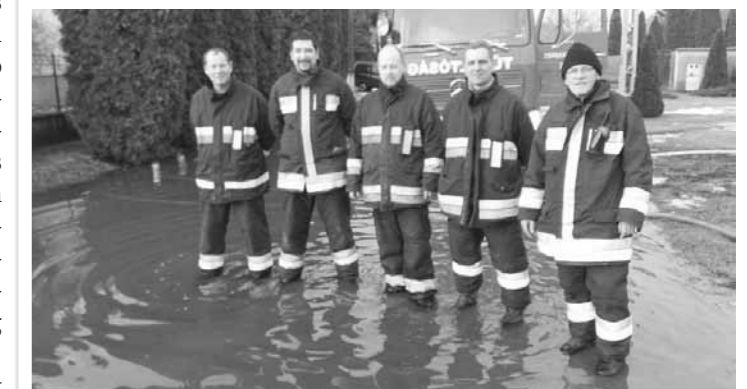
Belvíz a Tavasz utcában. A Császártöltési Önkéntes Tűzoltók segítettek a belvíz megszüntetésében.