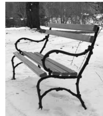
A Császártöltés Fejlődéséért Közalapítvány padokat vásárolt az Új temetőbe

Az Önök segítségével még többet tehetünk településünkért! Támogatásukat köszönjük!