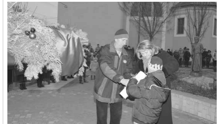
Gyertyagyújtás Advent negyedik vasárnapján