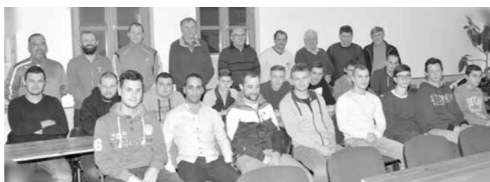
Évnyitó a futballcsapatnál