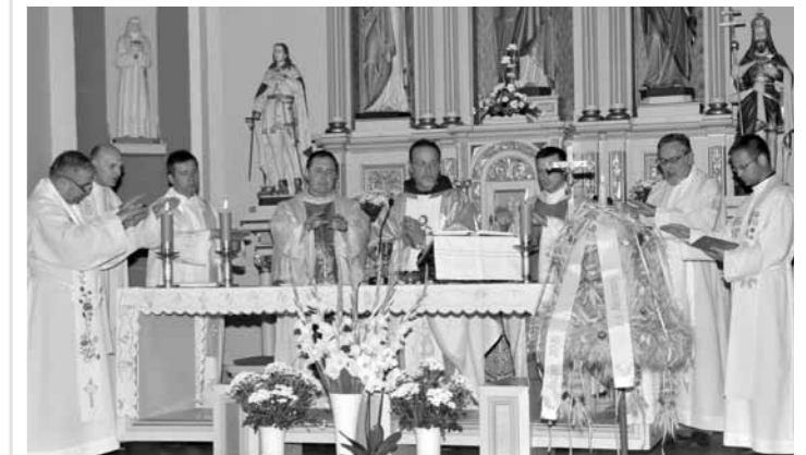
A császártöltési katolikus egyházközség tagjai zarándoklaton vettek részt Naszvadon. A zarándokok szent misén vettek részt az 1881-ben a Szent József tiszteletére szentelt római katolikus templomban.