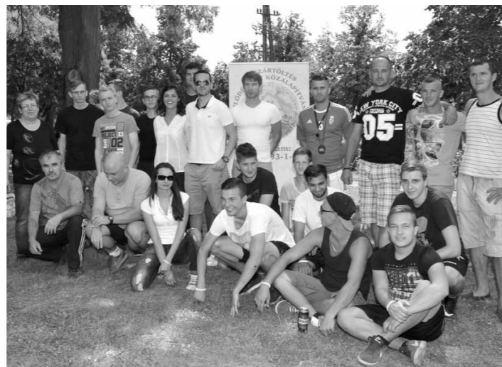
Képek a Falusi olimpiáról, melyet a Császártöltés Fejlesztéséért Közalapítvány szervezett