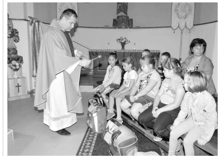
Táskaszentelés 2016. szeptember 1.