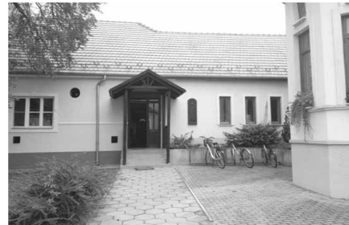
A köztéteztetésről 2016. szeptember 1-től Császártöltés Község Önkormányzata gondoskodik.