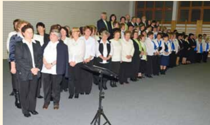
Katolikus kórusok találkozója