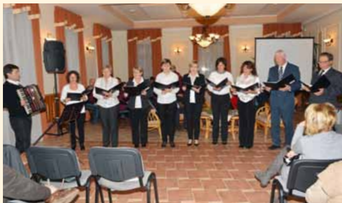
Császártöltési Sváb kórus fellépése Adventkor