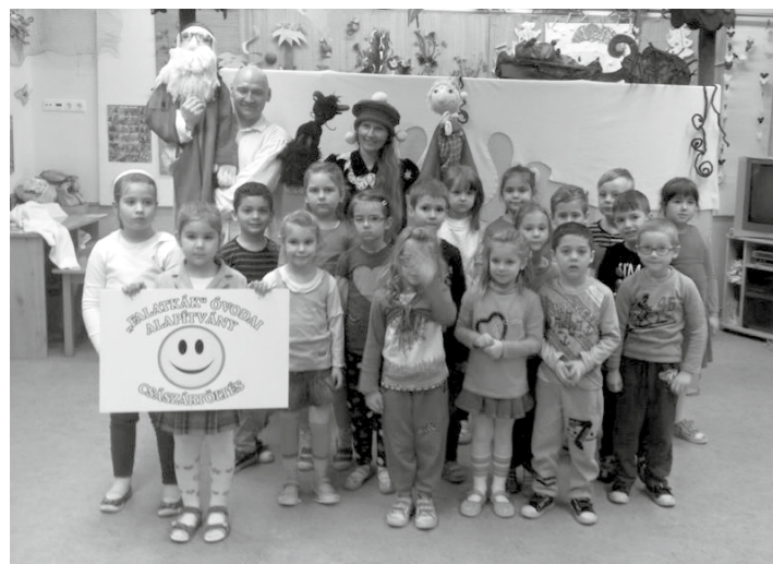
A „Falatkák” Óvodai Alapítvány ajándéka az ovisoknak - bábszínház télapóról, krampuszokról...