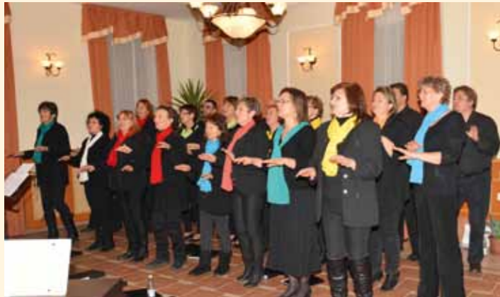
Kiskőrösi Gospel Sasok műsora