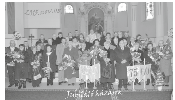
Jubiláló házaspár miséje 2015. november 8-án. Minden ünneplő párt szeretettel köszöntünk. Isten éltesse mindnyájukat!