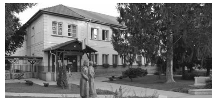
Német Nemzetiségi Óvoda és Iskola