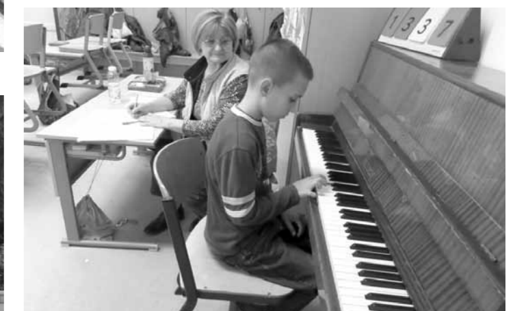
Újra indítottuk a zeneoktatást