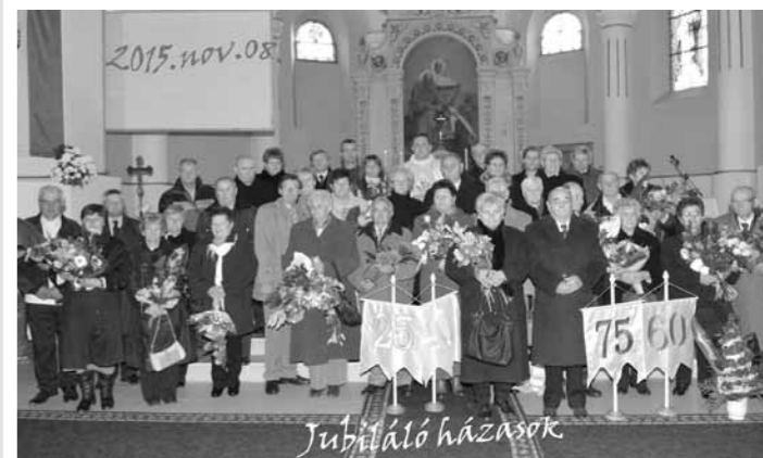
Jubiláló szentmise 2015. november 8.

ténések rövid elmesélése után kézzelkkel mutogatták el ezeket és így vésődtek be (remélhetőleg) a gyerekek emlékezetébe. Hangulatos órákat töltöttek el tanulóink és az egyetemes kultúra egyik legismertebb alkotásával ismerkedtek meg!