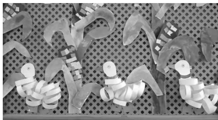
Libák a kukoricásban - nagycsoportosok munkája