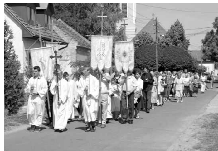
Úrnap körmenet 2015.