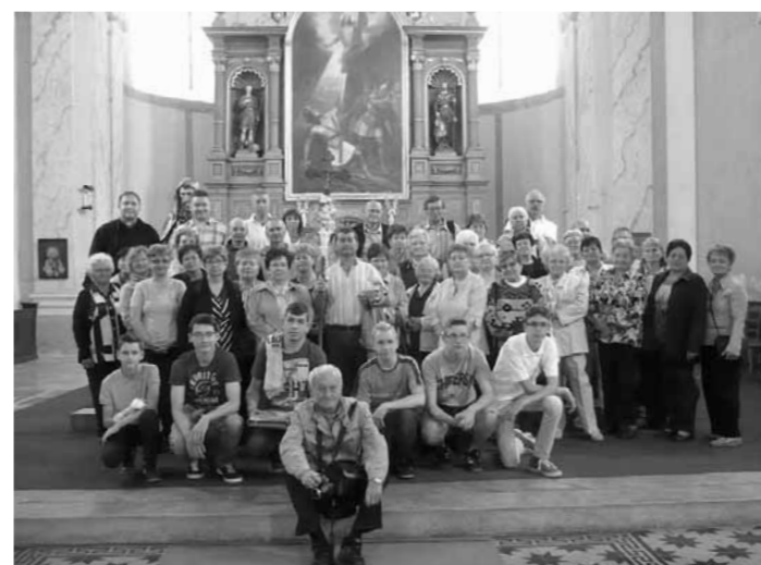
Császártöltési zarándokok Bács templomában 2015. június 27.