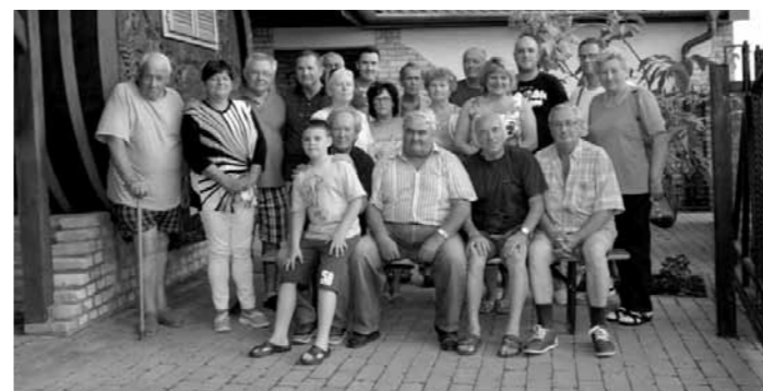
Takácsné Stalter Judit polgármester találkozott a Kissori pincesor tulajdonosaival 2015. június 15-én. A polgármester 2015. július 13-án az Arany János és Keceli utca lakóival találkozott.

tó, akinek csökkent 2-2 órával a munkaideje, nem fogadta el a változást és beadta a felmondását. A polgármester tudomásul vette döntésüket.