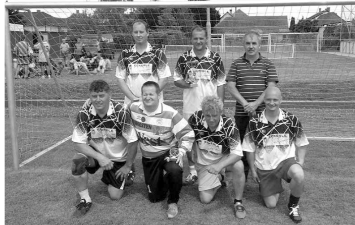
Császártöltés Öregfiúk - Soltvadkert I. helyezés Császártöltés