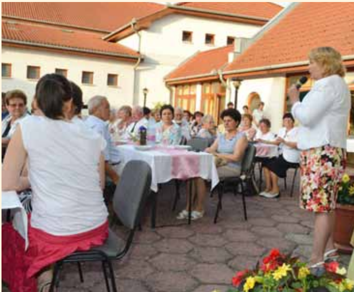
Nyugdíjas és aktív pedagógusok, óvónők, dadusok köszöntése