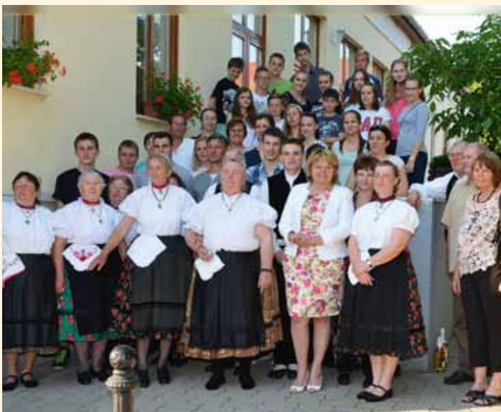
Köszönjük a Hajósi Énekkarnak és Néptáncgyűttesnek a közreműködést rendezvényeinken