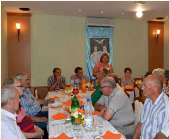
A Polgármesteri Hivatal és Önkormányzat aktív és nyugdíjas dolgozóinak köszöntése