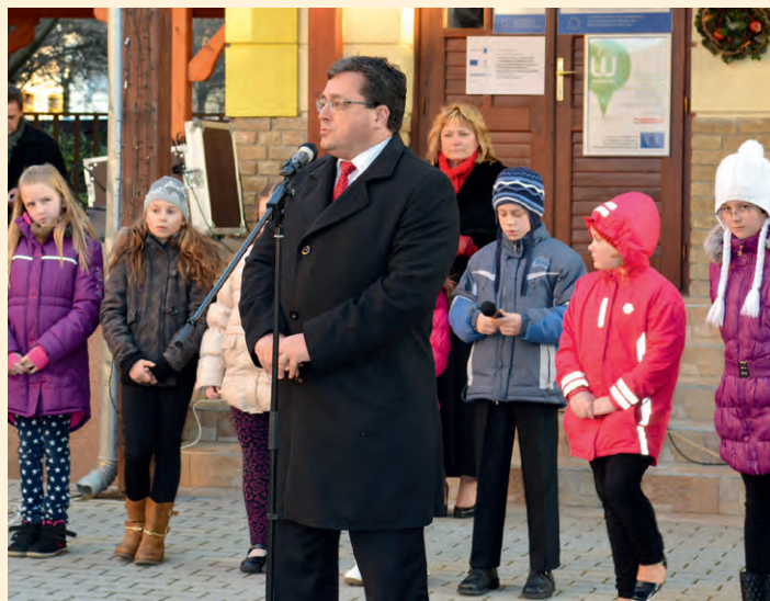
Bányai Gábor – országgyűlési képviselő