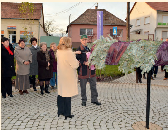
Takácsné Stalter Judit – polgármester